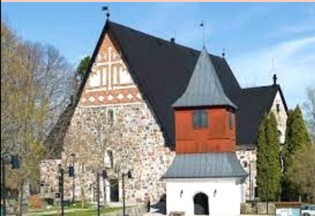
Espoon vanha tuomiokirkko

Sukuseuran vuoden 2021 varsinainen sukukokous pidettiin Espoon keskuksessa kauppakeskus Entressen kirjastossa. Korona varjosti jo toista vuotta peräkkäin sukutapahtumaamme ja rajoitti osanottajamäärää. Paikalle oli kuitenkin saapunut edustava joukko sukulaisia. Tämän johdosta saimme läpivietyä kaikki lakisääteiset asiat. Vapaaohjelmassa pääsimme tutustumaan Espoon vanhaan tuomiokirkkoon ja kirkkopuistoon. Sukukokouksesta voit lukea lisää lehden sivuilla 5-6.