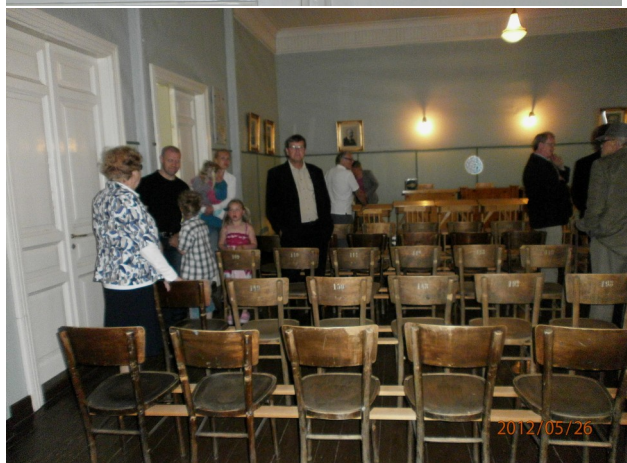
Sukuseuran väkeä tutustumassa istuntosaliin.