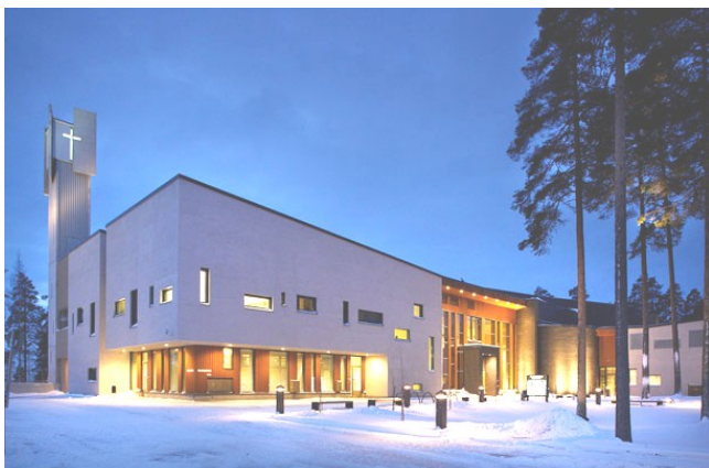
Sovituksen kirkko Hollolassa talvivalaistuksessa

Kevään Kohoskahvit-tilaisuus pidettiin Hollolassa lauantaina 4.5.2013. Kokouspaikkana oli Sovituksen kirkon seurakuntasali Salpakankaalla. Uusi kirkko ja seurakuntakeskus valmistuivat vuoden 2010 lopulla.