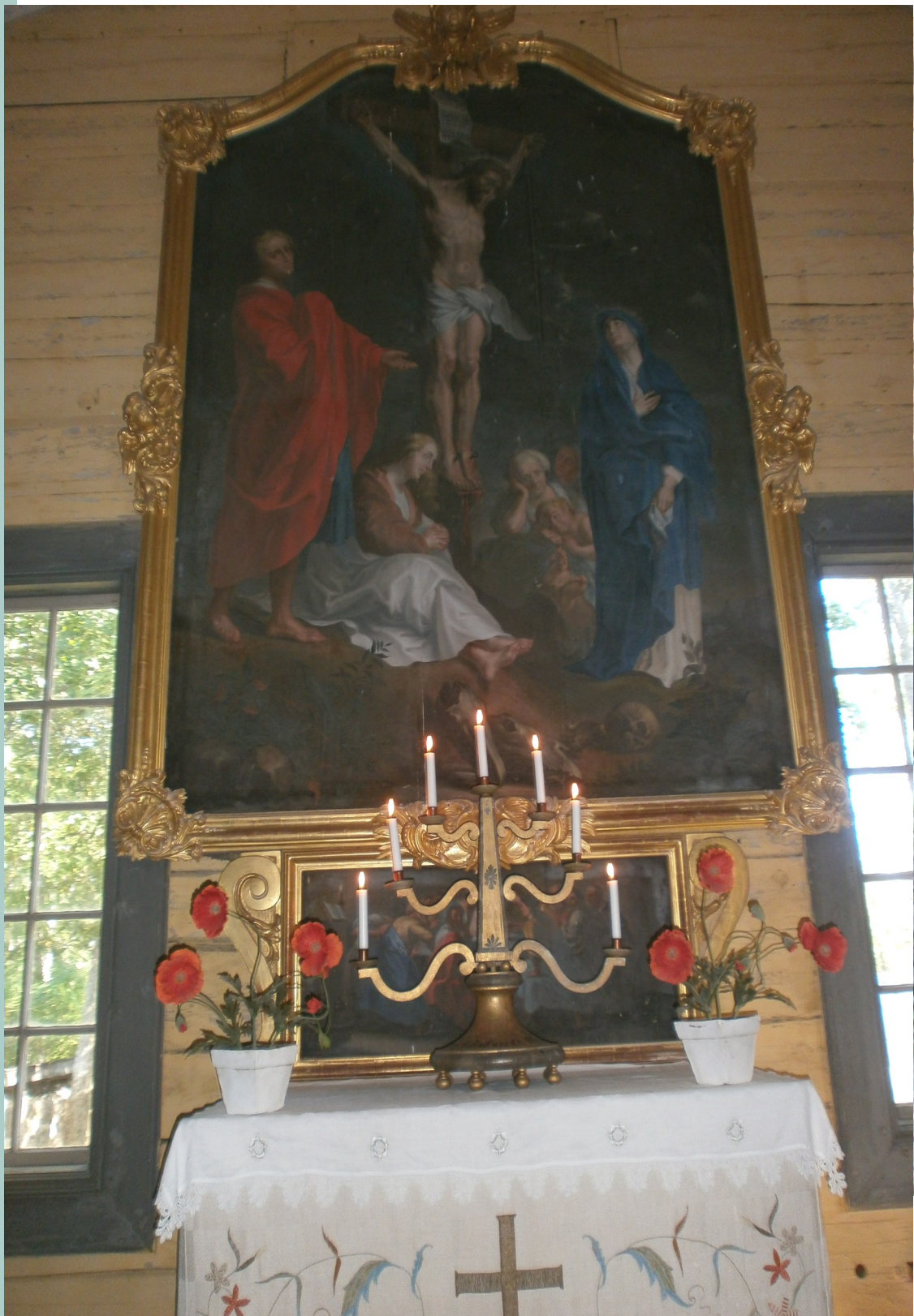
Fagervikin kirkko sijaitsee Fagervikin ruukinkartanon mailla Inkoon kunnassa. Se on yksi harvoista yksityisomistuksessa olevista Suomen kirkoista. Kirkko on hirsirakenteinen ristikirkko. Sen rakentajaksi mainitaan Joh. Friedrich Schulz vuonna 1737. Se on verhoiltu ulkoa pystylaudoituksella ja punamullattu. Kirkon kiinteää sisustusta pidetään alkuperäisenä. Ristiinnaulitsemista esittävä alttaritaulu on vuodelta 1738. Kirkon urut ovat Suomen vanhimmat alkuperäiskunnossa säilyneet soittokuntoiset urut.