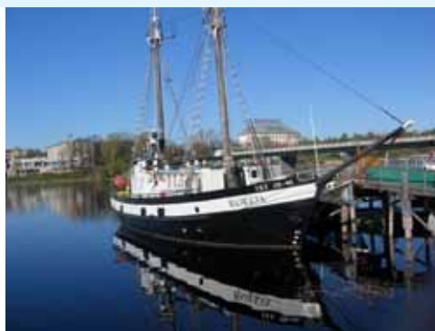
Oikealla Sortavalan satamaa, taustalla Vakkosalmen silta