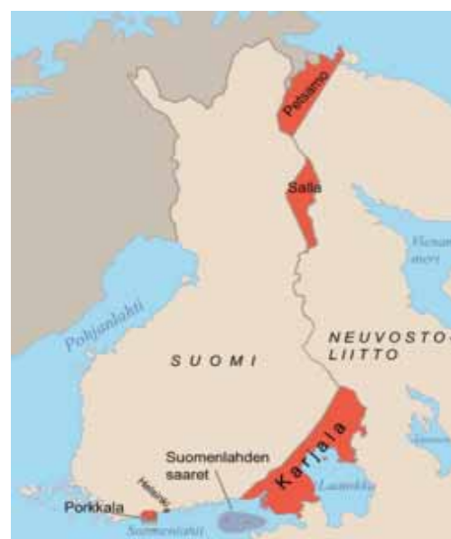
Suomen jatkosodan seurauksena menettämät alueet. Porkkala palautettiin Suomelle vuonna 1956.