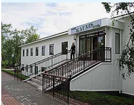
Vasemmalla Hotelli Kaunis Sortavalan keskustassa.