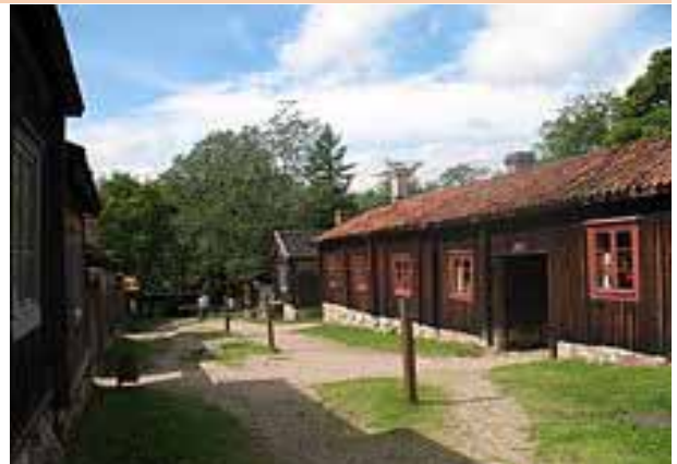
Kevään 2011 ”kohokas” oli mm. yhteinen retki Turun Luostarinmäen käsityöläismuseoon.

Karjalaistaustaisen sukuseuran käyttövoimana on tietysti ollut Karjala, tuo kauan kateissa ollut. Nyt kun sinne on jo päästy ja aina myös iloittu, että sieltä on päästy pois, alkaa tuokin käyttövoima ehkä hiipua. Jokainen uusi sukupolvi on edelliseen sukupolveen verrattuna jopa kaksinkertaisen matkan päässä Karjalasta, ja samaten aina vähintään kaksinkertaistuvan matkan päässä Kohosista, jos eivät satu itse olemaan suku-nimeltään Kohosia. Jokaisella on jo neljän sukupolven sisällä taaksepäin mentäessä jopa 16 sukua, joista voi valita, mihin haluaa kuuluvansa. Kaikkiin näihin sukuihin on tietysti geneettisesti yhtä pitkä tai lyhyt matka. Omalla kohdallani voisin valita Simpuroiden ja Kohosten lisäksi Kekäläisistä, Silvennoisista, Luukkaisista, Kinasisista, Uimosista ja en tiedäkään mistä kaikista. Minkä varaan sukuseuran toimintaa voisi rakentaa, kun sen perinteiset kivijalat, yhteinen tausta ja sukulaisuuden ja nimen tuoma yhteinen identiteetti, alkavat murentua?