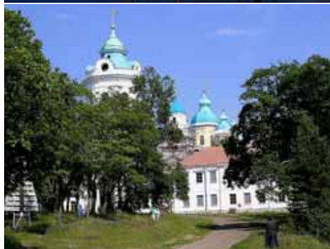
Oikealla Konevitsan luostari.