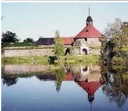
Vasemmalla Käkisalmen vanha linna.