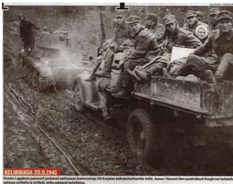
KELIRIKKOA 20.9.1941 Osasto Laguksen panssarit joutuivat auttamaan kuormastoja Itä-Karjalan kulkukelvottomilla teillä. Aunus-Vaaseni-tien puolivälissä Kuujärven kohdalla autossa kyyditään sotilaita ja siviilejä, jotka palaavat koteihinsa.

Yllä oleva kuva osui Lempisten poikien silmään satumalta ILTASANOMAT - lehden sivulta.